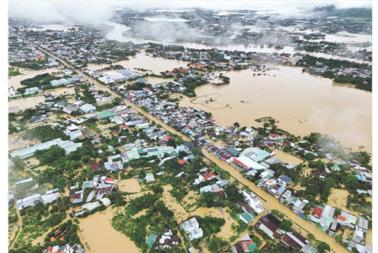
Hình ảnh ngập lụt khu vực Nha Trang (Khánh Hòa) ngày 19/11/2025

Ngày 23/11/2025, Phó Thủ tướng Hồ Đức Phớc ký Quyết định 2572/QĐ-TTg, hỗ trợ 1.100 tỷ đồng cho Khánh Hòa, Lâm Đồng, Gia Lai và Đắk Lắk. Trước đó hai ngày, ngày 21/11/2025, Phó Thủ tướng Thường trực Nguyễn Hòa Bình ban hành Quyết định 2549/QĐ-TTg, phân bổ 700 tỷ đồng cho bốn địa phương này để khắc phục hậu quả mưa lũ. Ngày 18/11/2025, Phó Thủ tướng Thường trực Nguyễn Hòa Bình ký Quyết định 2514/QĐ-TTg hỗ trợ 50 tỷ đồng cho Khánh Hòa; ngày 14/11/2025, Thủ tướng Phạm Minh Chính ban hành Quyết định 2485/QĐ-TTg hỗ trợ 700 tỷ đồng cho Huế, Quảng Ngãi, Gia Lai và Đắk Lắk. Ngày 7/11/2025, Phó Thủ tướng Hồ Đức Phớc ký Quyết định 2451/QĐ-TTg, hỗ trợ 80 tỷ đồng cho Quảng Ngãi, Gia Lai và Đắk Lắk để khắc phục thiệt hại do bão số 13. Ngày 01/11/2025, Thủ tướng Phạm Minh Chính đã ký các Quyết định 2427/QĐ-TTg và 2428/QĐ-TTg, hỗ trợ khẩn cấp 100 tỷ đồng cho Đà Nẵng và bổ sung 100 tỷ đồng cho Huế (đợt 2).