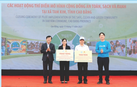
Trao tặng các kết quả các hoạt động thí điểm mô hình "Cộng đồng an toàn, sạch và xanh" cho xã Tam Kim, tỉnh Cao Bằng

Ngày 12/11/2025, tại xã Tam Kim, tỉnh Cao Bằng đã diễn ra sự kiện tổng kết các hoạt động thí điểm mô hình "Cộng đồng an toàn, sạch và xanh" kết hợp vòng chung kết cuộc thi "Nhà thiết kế sáng tạo xanh". Đây là chuỗi hoạt động ý nghĩa, thiết thực góp phần nâng cao nhận thức phòng, chống thiên tai và thích ứng biến đổi khí hậu, đặc biệt hướng đến đối tượng trẻ em.