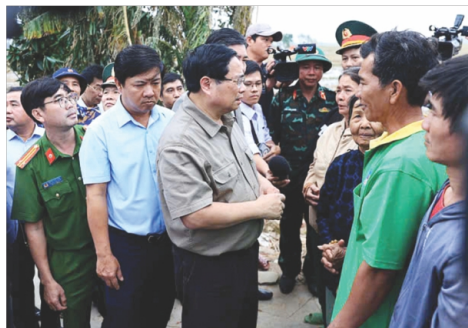
Thủ tướng Phạm Minh Chính thăm, động viên bà con nhân dân thôn Phú Hữu, xã Hòa Thịnh, Đắk Lắk

Để tăng tốc triển khai Nghị quyết 380/NQ-CP, ngày 30/11/2025, Thủ tướng ban hành Công điện 234/Đ-