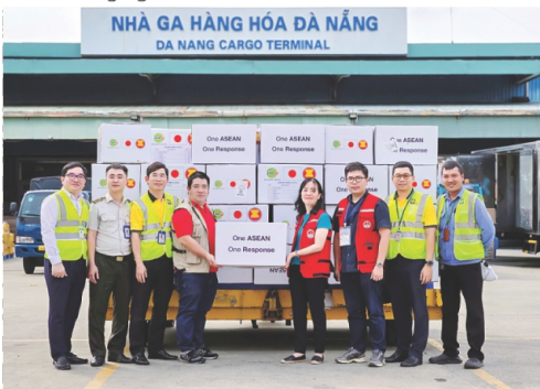
Tiếp nhận hàng viện trợ khẩn cấp của Trung tâm AHA cho người dân chịu ảnh hưởng bởi mưa, lũ tại Đà Nẵng