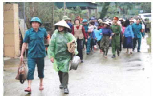
Người dân tham gia diễn tập sơ tán dân ứng phó với lũ, ngập lụt

Diễn tập sơ tán dân phòng chống lũ, ngập lụt tại xã Cẩm Duệ có nhiều điểm khác biệt và nổi bật khi lần đầu tiên sử dụng phần mềm giám sát thiên tai tỉnh Hà Tĩnh ( https://hatinh.pdms.dmptc.gov.vn ) và phần mềm