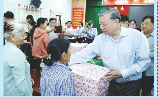
Tổng Bí thư thăm hỏi và tặng quà cho người dân ở thôn Khuông Phò Đông, thành phố Huế

Trước diễn biến tình hình bão số 13, mưa lớn và lũ đặc biệt nghiêm trọng tại miền Trung, công tác chỉ đạo điều hành của Đảng, Chính phủ và các bộ, ngành được triển khai ở mức cao nhất, xuyên suốt và liên tục. Cụ thể, Thủ tướng Chính phủ đã ban hành 17 Công điện, Nghị quyết số 380/NQ-CP ngày 25/11 về các giải pháp khắc phục hậu quả thiên tai, phục hồi sản xuất tại các địa phương khu vực miền Trung. Để tăng tốc triển khai Nghị quyết trên, ngày 30/11, Thủ tướng Chính phủ ban hành Công điện 234/Đ-TT phát động, triển khai “Chiến dịch Quang Trung” thần tốc sửa chữa, xây dựng lại nhà ở cho các gia đình có nhà bị thiệt hại.