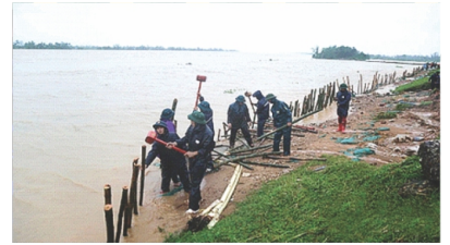
Các lực lượng hộ đê đang xử lý, khắc phục sự cố sạt trượt mái đê tại phường Quảng Phú