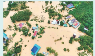
Nghệ An bị thiệt hại nặng do mưa lũ sau bão số 10

Theo quyết định, cụ thể hỗ trợ như sau: Tuyên Quang 200 tỷ đồng, Cao Bằng 195 tỷ đồng, Lạng Sơn 20 tỷ đồng, Lào Cai 200 tỷ đồng, Thái Nguyên 20 tỷ đồng, Phú Thọ 20 tỷ đồng, Sơn La 200 tỷ đồng, Lai Châu 24 tỷ đồng, Điện Biên 90 tỷ đồng, Ninh Bình 20 tỷ đồng, Thanh Hóa 200 tỷ đồng, Nghệ An 500 tỷ đồng, Hà Tĩnh 500 tỷ đồng, Quảng Trị 200 tỷ đồng, Huế 135 tỷ đồng.