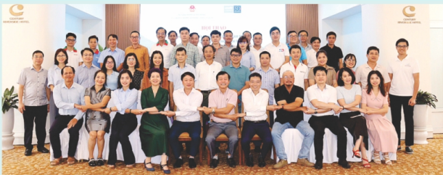
Các đại biểu tham gia chương trình hội thảo

Ngày 17 và 18/9, tại TP. Huế, Cục Quản lý đề điều và Phòng, chống thiên tai (PCTT) phối hợp UNICEF Việt Nam tổ chức Hội thảo "Tập huấn về truyền thông, lấy trẻ em làm trung tâm trong các tình huống thiên tai" cho phóng viên các cơ quan báo chí các tỉnh Quảng Trị, Đà Nẵng, Huế.