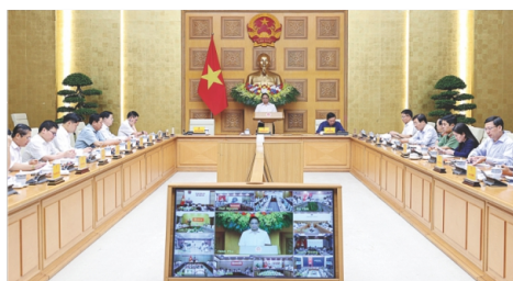
Thủ tướng Phạm Minh Chính chủ trì cuộc họp của Thường trực Chính phủ trực tuyến với các địa phương về công tác khắc phục hậu quả cơn bão số 10 và mưa lũ sau bão

Nhận định đây là cơn bão mạnh, di chuyển rất nhanh và ảnh hưởng rộng, cả hệ thống chính trị từ trung ương tới cơ sở đã vào cuộc quyết liệt từ sớm, từ xa. Ngày 28/9/2025, Văn phòng Trung ương Đảng có Công văn số 17940-CV/VPTW về ý kiến của Thường trực Ban Bí thư chỉ đạo ứng phó với cơn bão số 10. Thủ tướng Phạm Minh Chính đã ban hành 5 công điện chỉ đạo tập trung ứng phó, khắc phục hậu quả bão và mưa lũ. Ban Chỉ đạo Phòng thủ dân sự