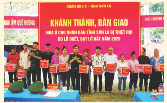
Tặng quà cho các gia đình có hoàn cảnh khó khăn trên địa bàn các xã bị thiệt hại, ảnh hưởng do thiên tai, mưa lũ, sạt lở đất

Đồng thời, để ghi nhận thành tích xuất sắc trong phòng chống, khắc phục hậu quả mưa lũ, Bộ Trưởng Bộ quốc phòng đã tặng bằng khen cho 2 tập thể, 4 cá nhân; Chủ tịch UBND tỉnh tặng bằng khen 18 tập thể, 26 cá nhân và trao nhiều suất quà cho các hộ gia đình có hoàn cảnh khó khăn tại các xã bị thiệt hại, ảnh hưởng do thiên tai, mưa lũ, sạt lở đất. NAM MINH