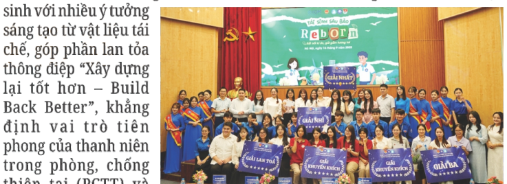
Các đội đạt giải tham gia cuộc thi Tái sinh sau bão - Kết nối ký ức, gửi gắm tương lai"

Nằm trong chuỗi hoạt động hưởng ứng Ngày Quốc tế giảm nhẹ rủi ro thiên tai (13/10), ngày 16/9, Cục Quản lý đề điều và Phòng, chống thiên tai phối hợp với Tổ chức Di cư quốc tế (IOM) và Trường Đại học Sư phạm Hà Nội tổ chức vòng chung kết Cuộc thi "Tái sinh sau bão - Kết nối ký ức, gửi gắm tương lai". Sau hơn một tháng triển khai, cuộc thi thu hút đông đảo sinh viên, học sinh với nhiều ý tưởng sáng tạo từ vật liệu tái chế, góp phần lan tỏa thông điệp "Xây dựng lại tốt hơn – Build Back Better", khẳng định vai trò tiên phong của thanh niên trong phòng, chống thiên tai (PCTT) và thích ứng với biến đổi khí hậu (BĐKH).