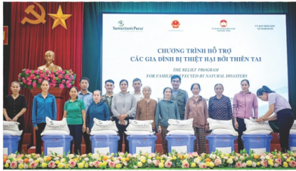
Cục Quản lý đề điều và PCTT phối hợp Tổ chức Samaritan's Purse trao tặng gói hỗ trợ khẩn cấp cho 350 hộ gia đình bị ảnh hưởng bởi bão số 10 tại Hà Tĩnh

Ngoài ra, Cục Quản lý đề điều và Phòng, chống thiên tai đã phối hợp với Công ty Cổ phần Acecook Việt Nam kịp thời triển khai cứu trợ khẩn cấp, hỗ trợ người dân bị ảnh hưởng nặng nề tại tỉnh Tuyên Quang 1.000 thùng mì và Hà Tĩnh 700 thùng mì. Đây là những hoạt động hỗ trợ thiết thực, kịp thời từ các tổ chức quốc tế, doanh nghiệp thể hiện sự chung tay của cộng đồng trong nỗ lực giúp người dân vùng thiên tai vượt qua khó khăn, sớm ổn định cuộc sống và phục hồi sinh kế. MỸ HẰNG