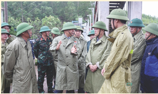
Thủ tướng Bộ NN&MT Nguyễn Hoàng Hiệp kiểm tra việc vận hành, đảm bảo an toàn cho công trình và vùng hạ du tại hồ Kẻ Gỗ chiều 28/9/2025

Từ ngày 01/9-30/9/2025, trên cả nước đã xảy ra 12 loại hình thiên tai bao gồm: 04 cơn bão, gió mạnh trên biển; mưa lớn, lốc, sét, lũ, ngập lụt, lũ quét, sạt lở đất tại khu vực Bắc, Trung Bộ; Nắng nóng ở khu vực Bắc Bộ, Nam Bộ; động đất xảy ra tại Đà Nẵng, Quảng Ngãi, trong đó bão số 9 đạt cấp siêu bão trên biển Đông và là cơn bão mạnh nhất thế giới năm 2025; bão số 10 đạt cường độ cấp 12-13 đổ bộ vào khu vực các tỉnh từ Nghệ An đến Quảng Trị.